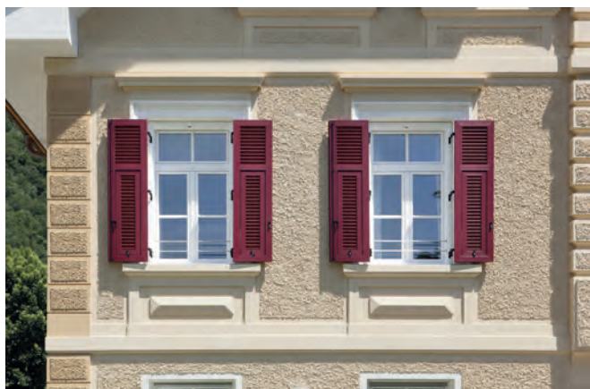
Le finestre si adattano perfettamente al design dell'edificio (Bolzano)

È possibile provvedere alla eliminazione delle barriere architettoniche. Per rendere possibile l'accesso al balcone o alla terrazza senza barriere, sono disponibili sistemi di soglie comode e adatte ad ogni esigenza per le porte di casa e di balcone.