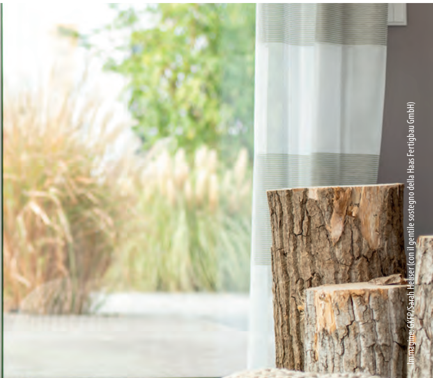
Immagine: GfK/Sarah Heuser (con il gentile sostegno della Haas Fertigung GmbH)