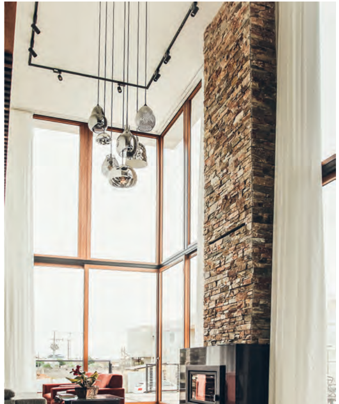
Profili con effetto legno per finestra di grande superficie