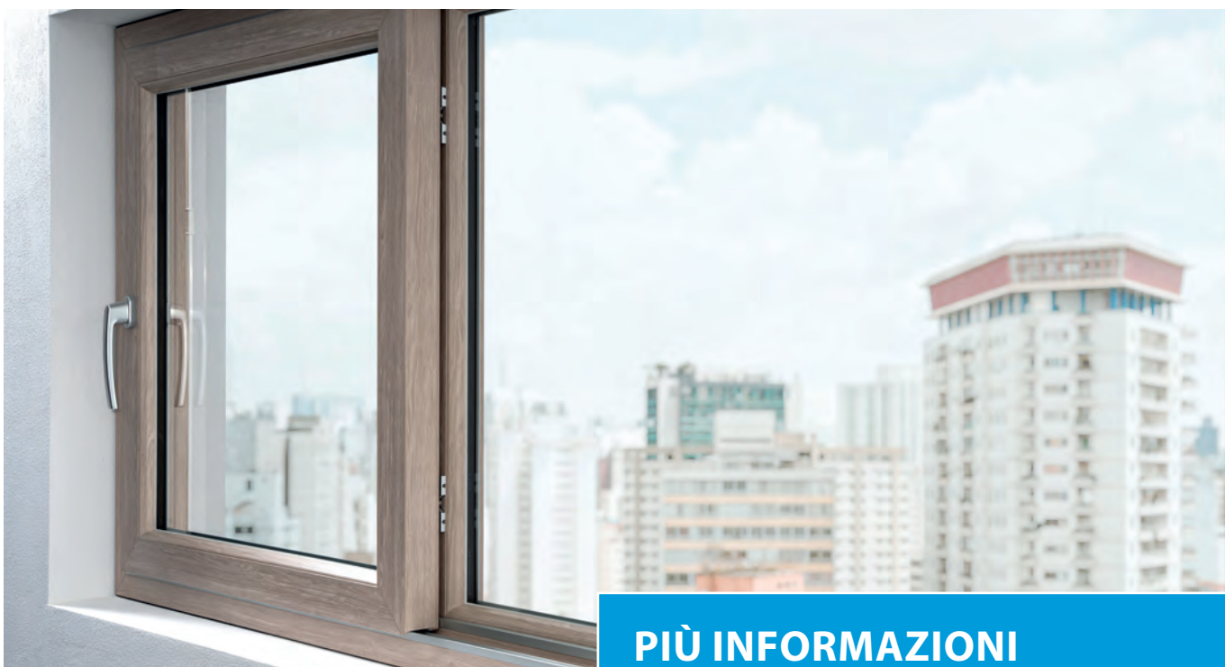
Il rumore della città rimane all'esterno