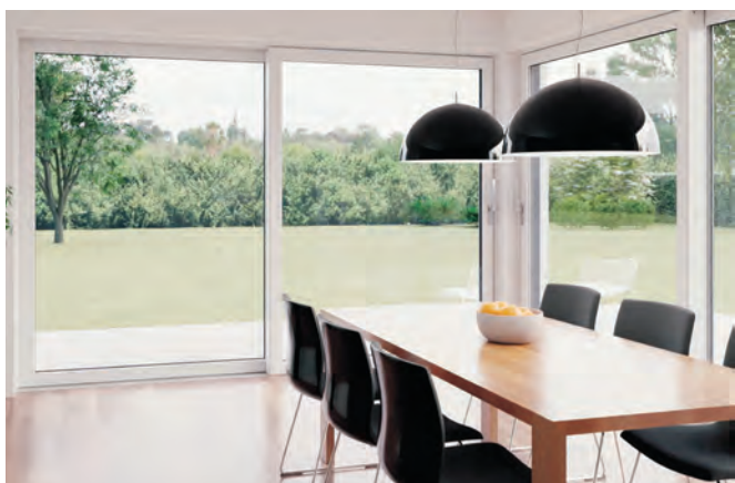
Le classiche finestre di colore bianco sono sempre utilizzate

Di solito è la semplicità delle cose che ci convince – che si tratti di linee rette, angoli di 90° o forme non adeguate. Per le finestre in PVC-U, i profili e i telai sono oggi realizzati con differenti spessori, in funzione dell'impiego: spessore tradizionale di circa 74 mm, per la ristrutturazione 70 mm, per un maggiore risparmio energetico 80 mm. Non importa se si guardano le finestre