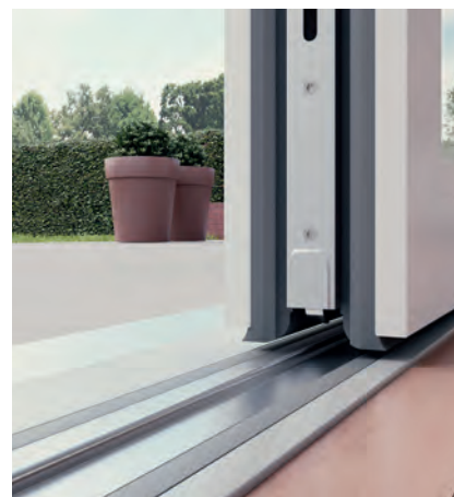
Accesso alla terrazza senza barriere insuperabili