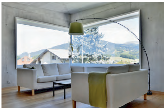
I nuovi profili permettono un design insolito