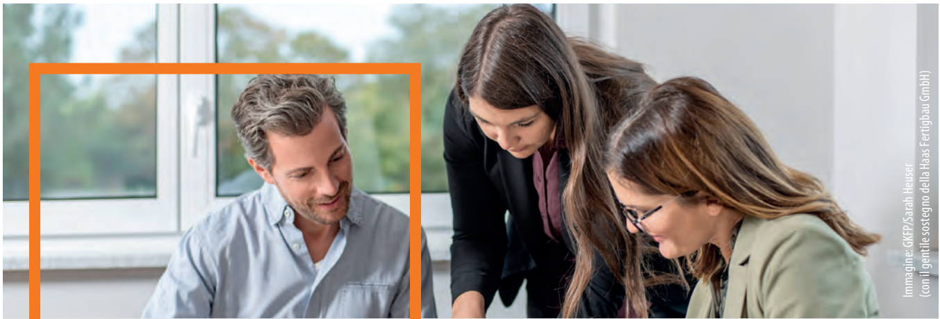
Immagine: GKEP/Sarah Heuser (con il gentile sostegno della Haas Fertighau GmbH)