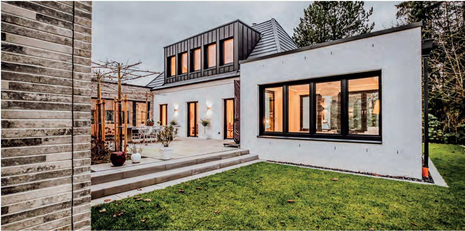
I profili colorati sono particolarmente popolari per le ristrutturazioni