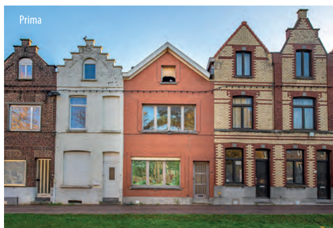
Immagine: Deceuninck | Immagine grande in alto e in basso a sinistra: dopo la ristrutturazione; in basso a destra: prima dell'intervento