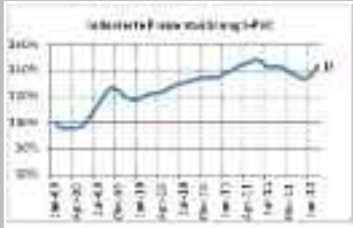
Abbildung 1: PVC Preisentwicklung Figure 1: PVC price trends